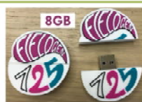
USB-Stick 8 €