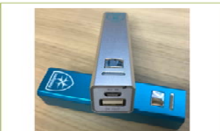
Chargeur 10 €