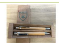
BambooSet 6 €

Articles disponibles au secrétariat de l'école